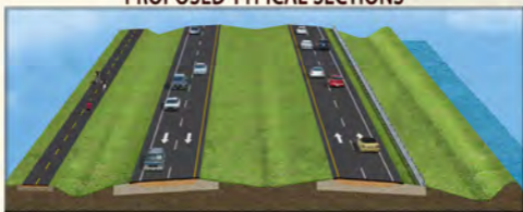
Figure 1 - From CR 880 to Lion Country Safari Road