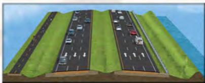
Figura 2 - Desde Lion Country Safari Road hasta Palms West Parkway