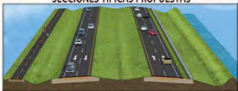
Figura 1 - Desde CR 880 hasta Lion Country Safari Road