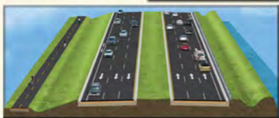
Figure 3 - From Palms West Parkway to Forest Hill Boulevard