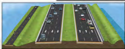
Figura 3 - Desde Palms West Parkway hasta Forest Hill Boulevard